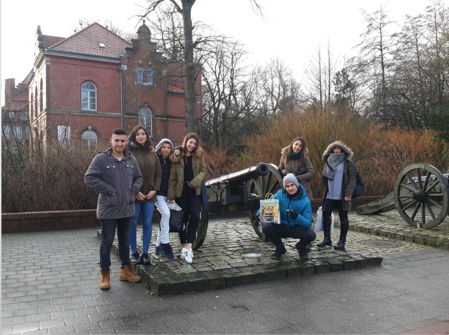
Cuxhaven Şehri Tanıtımı